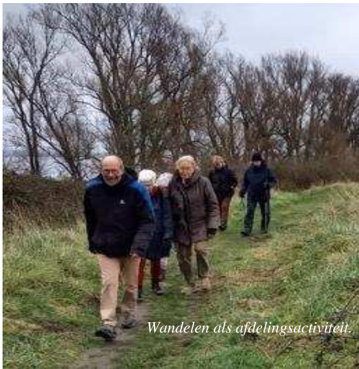
Wandelen als afdelingsactiviteit.

De afdelingen zijn binnen de organisatie van de KBO de plaats waar de activiteiten plaats vinden en waar het directe contact met de leden inhoud wordt gegeven. De leden van de afdeling vormen samen een vereniging met eigen bestuur en bepalen zelf de hoogte van de contributie. Bij de activiteiten gaat het vaak om ontspanning en ontmoeting, voorlichting en informatieve bijeenkomsten. Daarnaast behartigt de afdeling de belangen voor de leden, soms in samenwerking met de betreffende kring. Het aantal afdelingen varieerde van 33 tot 29 ultimo 2023. De afdelingen met hun leden vormen de basis van de KBO-organisatie, in wier belang de provinciale en landelijke organisatie dienstverlenend en ondersteunend werkzaam waren.