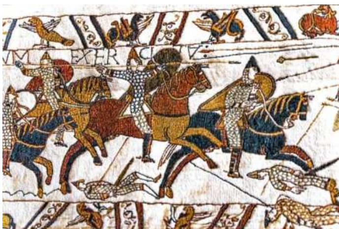
Detail van het Tapijt van Bayeux.

Vervolgens naar Honfleur, een karakteristiek vissersplaatsje bekend om zijn Fruits de Mer, maar helaas regende het toen de hele tijd behoorlijk hard.