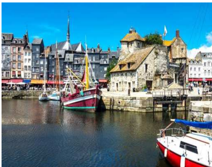
De haven van Honfleur

Vervolgens naar Honfleur, een karakteristiek vissersplaatsje bekend om zijn Fruits de Mer, maar helaas regende het toen de hele tijd behoorlijk hard.