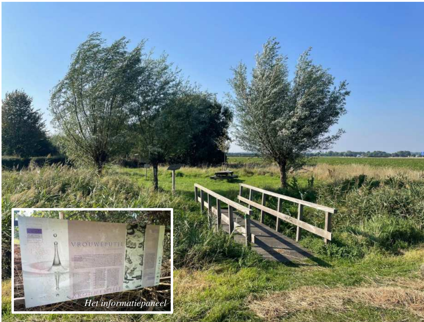
De ingang aan de Oostweg tussen 's-Heer Arendskerke en de Sinoutskerkseweg.