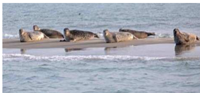
Een kolonie zeehonden

Wat te denken van een mosselbank, een oesterbed, Een bende kalkoenen, een crash neushoorns, een drift ossen, een familie apen, een klucht/kluft fazanten.