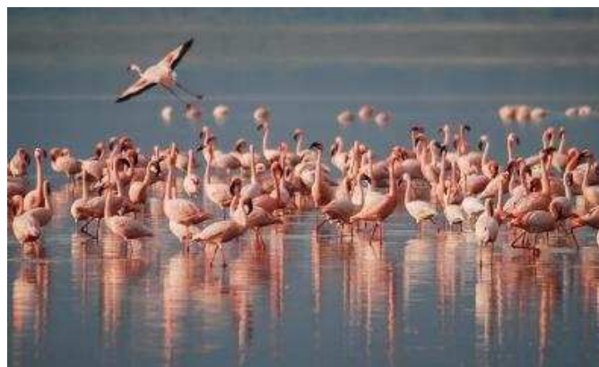
Een tribune flamingo's (ook wel flamboyance of kolonie)

Wel eens gehoord van een koppel duiven, een kudde schapen, een kwaak kikkers, een pak vossen, een meute jachthonden, een parlement uilen, een rotte everzwijnen, een span honden, een sprong herten?