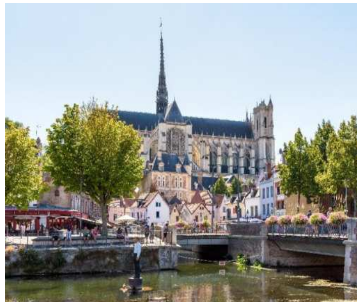
De Kathedraal van Amiens.