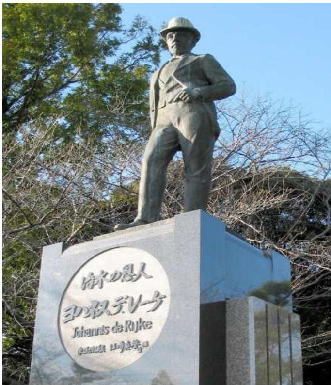
Het standbeeld in Colijnsplaat is een in Japan gemaakte replica van dit bronzen beeld te Nagoya.

Johannis was in Japan eerst nog laag in rang, maar hij blonk zo uit dat hij van alle 'watermannen' het snelst promotie maakte. Zijn werk zorgde ervoor dat er geen overstromingen meer plaatsvonden en de natuur zich kon ontwikkelen.