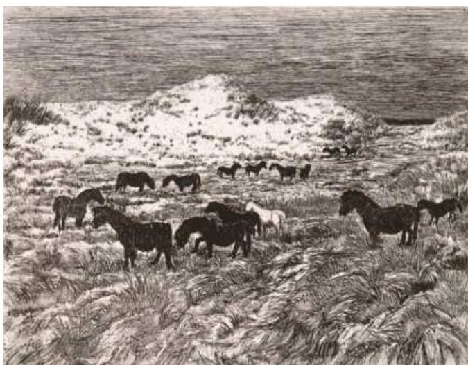
Illustratie: Paarden in de duinen.

Ze ging in 1955 een jaar naar Genève waar ze cursussen beeldhouwen deed aan de École Supérieure des Beaux-Arts . Van 1956 tot 1961 bezocht ze de Koninklijke Academie in Den Haag waar ze onder anderen les kreeg van Rein Drayer (1899-1986), Paul Citroen (1896-1983) en de beeldhouwer Dirk Bus (1907-1978).