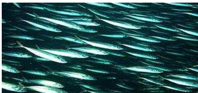
Een school vissen

De liefde voor dieren is in Nederland ook af te lezen aan de oprichting in 2002 van een Partij voor de Dieren. Deze partij streeft naar een diervriendelijk beleid, behaalde in 2023 drie zetels in de Tweede Kamer en staat bekend om de vele vragen die zij aan ministers stelt. Nederland is het eerste land waarin een partij die dieren tot hoofddoel heeft in het parlement vertegenwoordigd is.