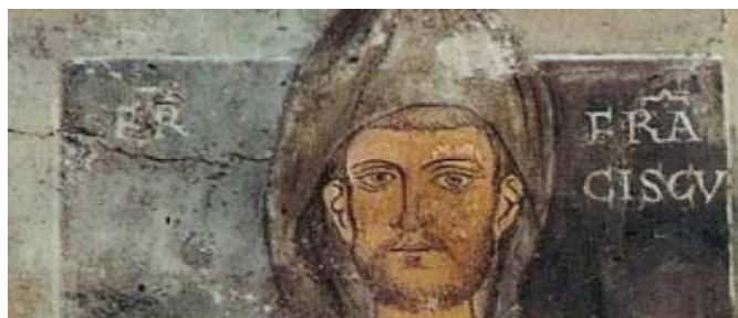
Oudst bekende afbeelding van Franciscus van Assisi

Een beroemde legende over Franciscus' liefde voor de natuur is dat hij eens een preek tegen de vogels heeft gehouden. Hij was onderweg met een aantal metge-