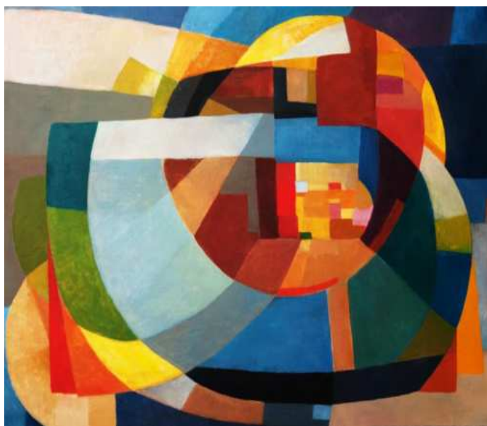
Ook een vorm van kubisme probeerde Miems uit.

die – naar eigen zeggen – in z'n vrije tijd ook nog schoolmeester was.