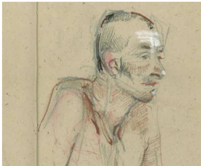
Portretstudie in haar schetsboek.