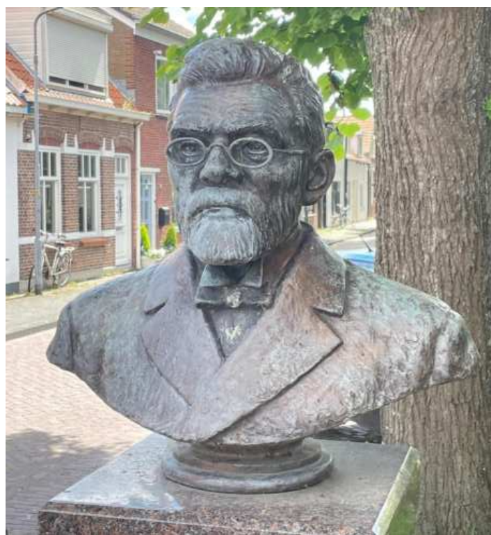
Behalve met een standbeeld eert Colijnsplaat zijn beroemde zoon ook met een borstbeeld.