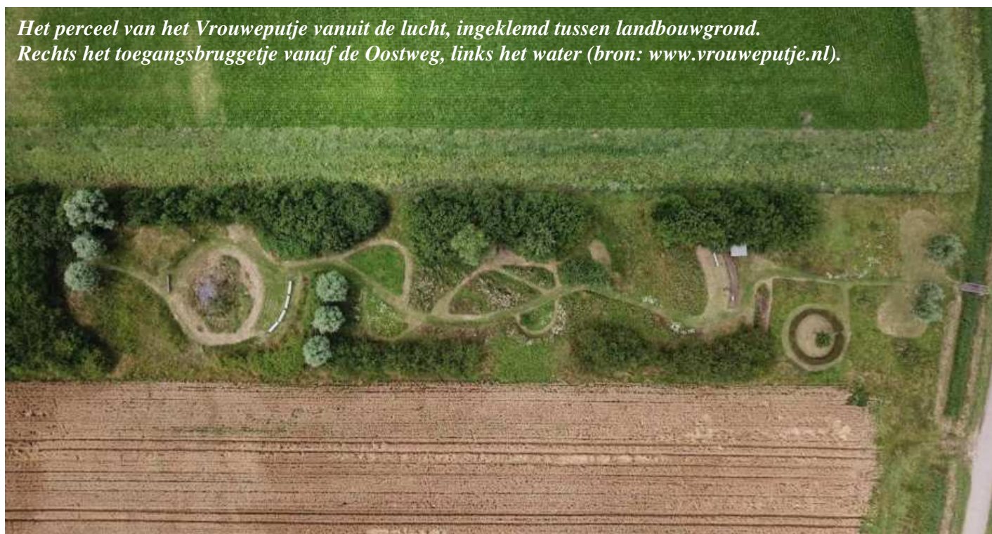
Het perceel van het Vrouweputje vanuit de lucht, ingeklemd tussen landbouwgrond. Rechts het toegangsbruggetje vanaf de Oostweg, links het water (bron: www.vrouweputje.nl ).