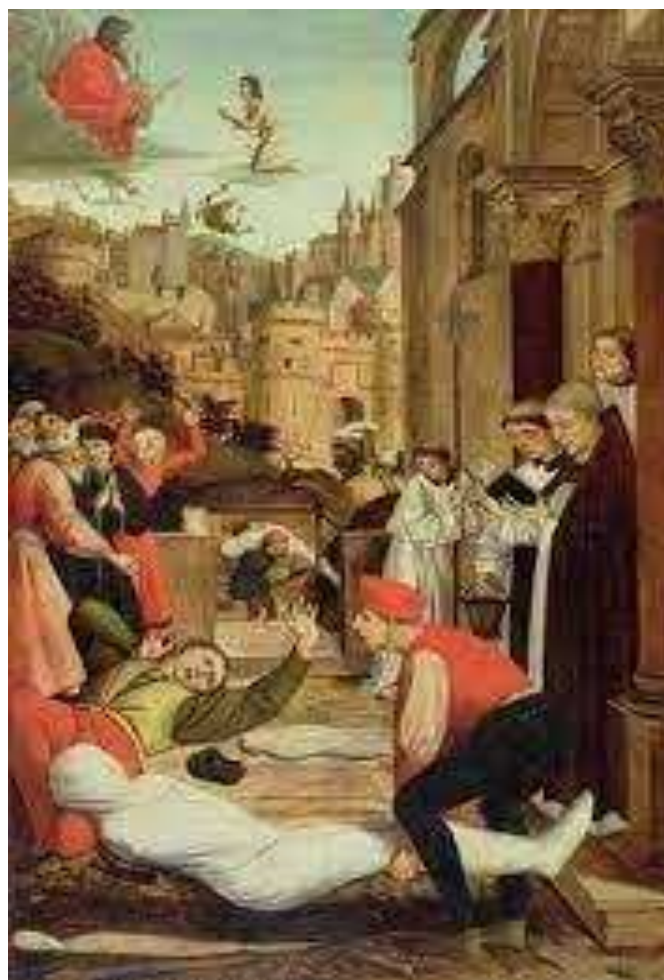
De pest, een straf van God?

Het is een vraag om gebed op de twee belangrijkste momenten van ons leven: nú en bij het moment van onze dood.